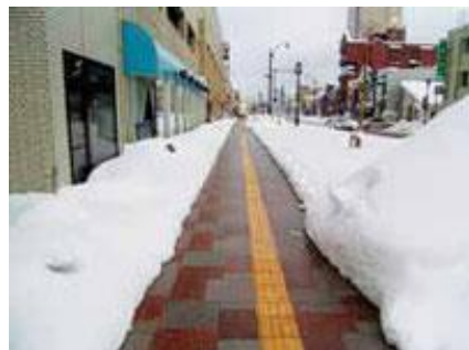
ヒートパイプによる融雪状況 (青森市うとう橋通り歩道)